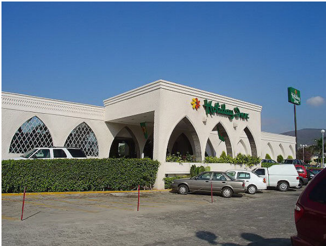
Holiday Inn, hotel sede Tuxtla Gutiérrez, Chiapas

Como parte de las actividades del X Consejo Directivo de la FECIME, se llevará a cabo la Octava Asamblea General Ordinaria el día Sábado 1 de Agosto del presente a las 9:00 horas en Segunda Convocatoria, teniendo lugar las instalaciones del Colegio de Ingenieros Mecánicos y Electricistas de Chiapas, A.C. (CIME CHIAPAS, A.C.), ubicado en Av. Paseo de las Gárgolas, No. 160, Col. Infonavit Chapultepec Ampliación Atenas, en la ciudad de Tuxtla Gutiérrez, Chiapas. La orden del día para la asamblea consistirá en lo siguiente: