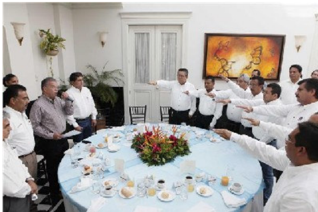
Durante la Toma de Protesta del XI Consejo Directivo del CIME Tabasco

El día 22 de Julio del presente, se llevó a cabo la Toma de Protesta del XI Consejo Directivo del