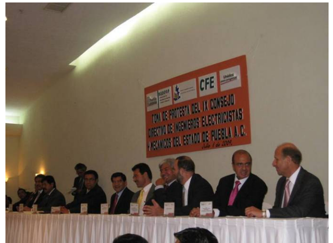
Mesa de presidium en la Toma de Protesta del IX Consejo Directivo del CIME Puebla

El día 1 de Julio del presente, en el Salón Orquídeas del Hotel Marrito Real Puebla, en la ciudad de Puebla, Puebla se llevó a cabo la Toma de Protesta del IX Consejo Directivo del Colegio de Ingenieros Mecánicos y Electricistas del Estado de Puebla, A.C. ante un nutrido grupo de asistentes al magno evento.