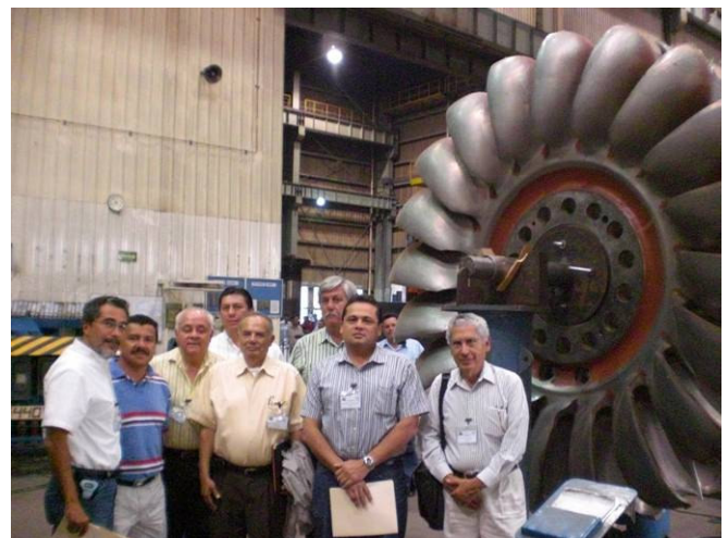
Durante la visita a la Empresa Andritz Hydro, Fabricante de Turbinas Hidráulicas

¡Muchas gracias CIME Michoacán y hasta pronto!